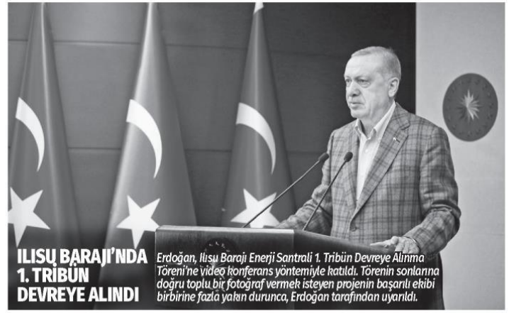
ILISU BARAJI'NDA 1. TRIBÜN DEVREYE ALINDI

Bölücü teröre boyun eğmediğimiz gibi sokak terörüne de asla müsaade etmeyeceğiz. Siyasete şiddet bulaştırmak isteyen şehir eşkıyalarına izin vermeyeceğiz. Türkiye'nin birliğine, beraberliğine, ebedi ve ezeli kardeşliğine kastedenler hak ettikleri cevabı hukuk içinde muhakkak alacaklardır.