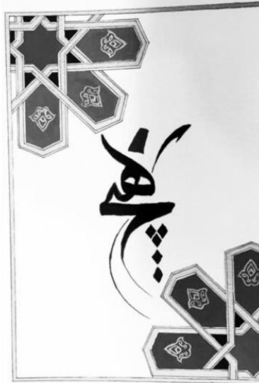
Karantinada 2 çocuğuyla kalan Büşra Nesil, "Hoş bir anı olarak klasik İslam sanatı ile bir resim yaptım ve hediyeye bıraktım" dedi.

K ENYA ve Tanzanya'dan getirilen 272 Türk vatandaşı arasında bulunan 2 çocuk annesi Büşra Nesil, Samsun'daki 14 günlük karantina süresinin bitmesinin ardından evine gitti.